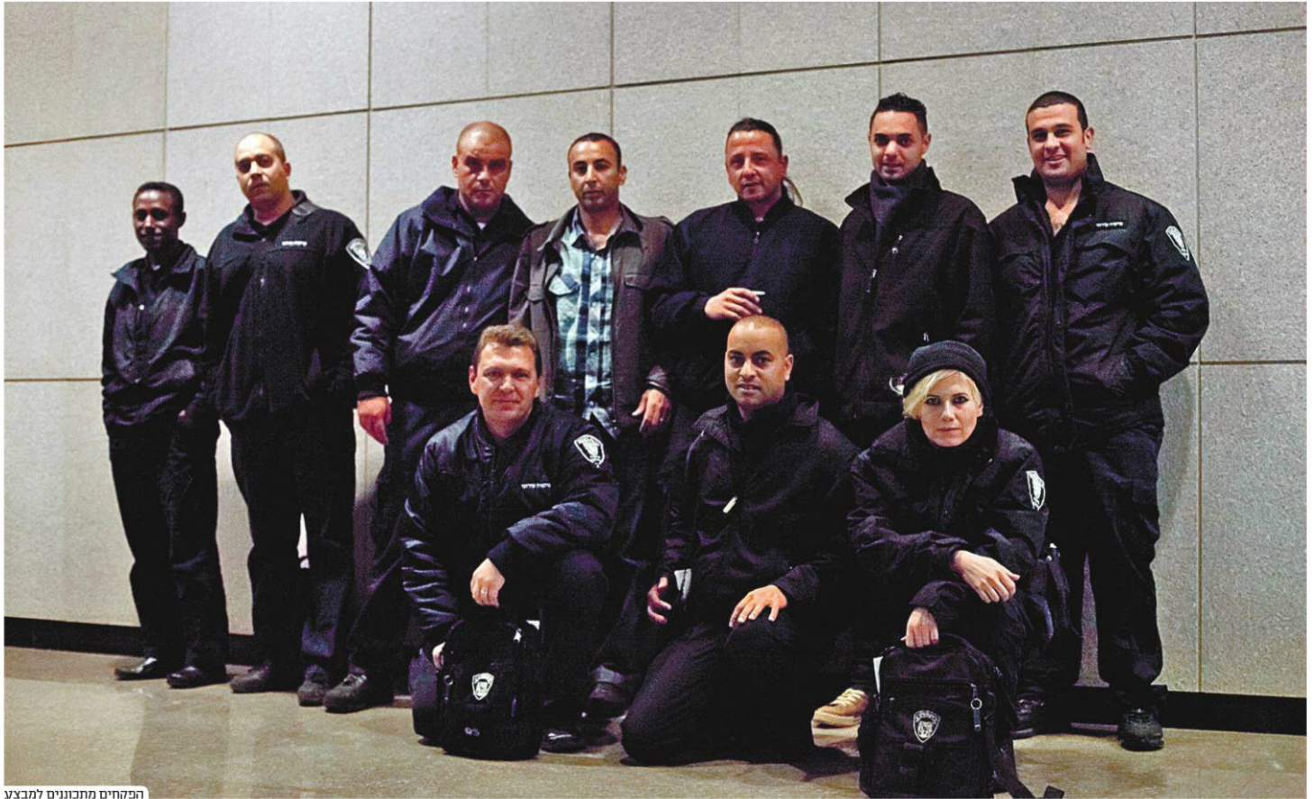
המפקחים מתכוננים למבצע

לעובדים שלי שהשקיעו ובאמת תרמו לתוצאה המכוברת. בשביל הפעם הראשונה מדובר בתוצאה יפה מאוד, וממכצע למבצע אנחנו נוכיח את העיילות שלנו עוד יותר. ראש עיריית רחובות רחמים מלול: "קיימנו את האכיפה הזאת ספציית פית כי קיבלנו תלונות רבות מאורחים על כך שנושא העישון במקומות ציבוריים מפריע להם, ואנחנו רוצים שהם ימשיכו לבלות מבלי לסבול מעשן הסיגריות. אנחנו נמשיך במבצעי האכיפה". *